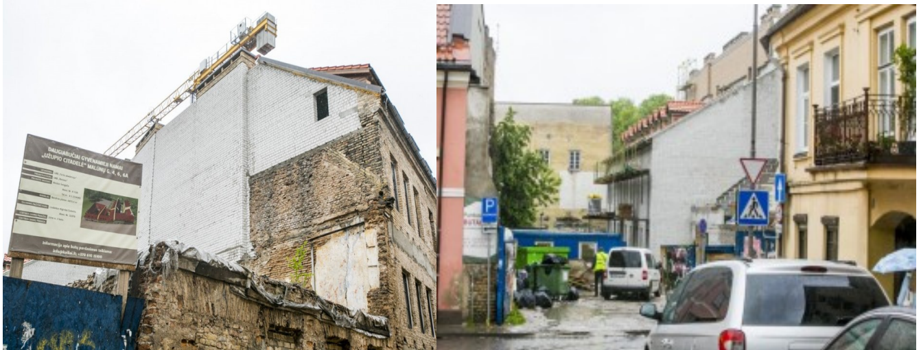
Šių dienų vykdomos rekonstrukcijos pastate Malūnų g. 6, Vilniuje